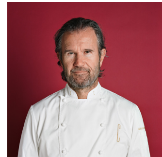
06 Carlo Cracco Chef