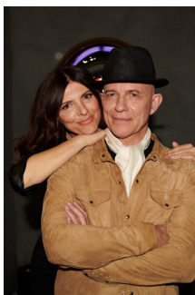
16 Draga&Aurel @Anne Timmer Creative Valerie van der Werff